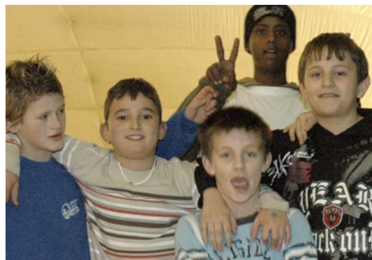
Teilnehmende OS Rüti, Winter 07/08

Das dreistündige Powerplay wird in zwei Phasen durchgeführt: Während der ersten Hälfte des Abends werden im Stil von Midnight Sports zwei Mannschaftssportsarten angeboten. Zusätzlich finden Tischtennisrundlauf, Tischfussball, Springseile und andere offene Angebote ihren Platz in der Halle oder auf dem Aussenplatz. Die Spiele werden in wechselnder Mannschaftszusammensetzung und ohne Schiedsrichter ausgetragen.